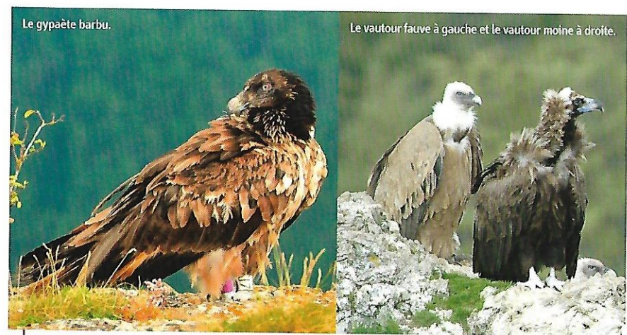
Le gypaète barbu.

À partir de là commence la partie en falaise. Les passages aériens se succèdent et les paysages sont somptueux. Les vautours survolent souvent les lieux. Les passages et rochers surplombants sont équipés de balustrades, bien rester sur le chemin. Dans une faille, le sentier nécessite l'aide des mains. Une barrière pour les moutons est installée, veiller à la refermer. Après plusieurs circonvolutions, le sentier, dominant, rejoint le sentier de montée qui ramène au départ.