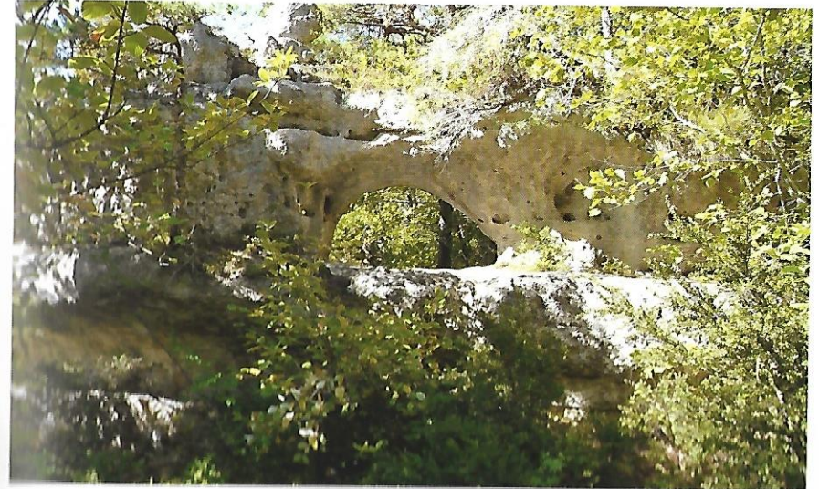
Une arche au bord du sentier.