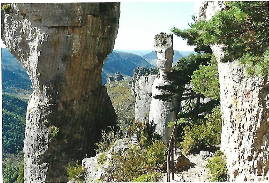
Les vases de Sèvres et de Chine.